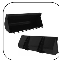
Cazo de una pieza