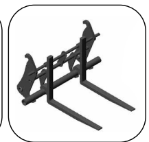
Horquillas para enganche rápido